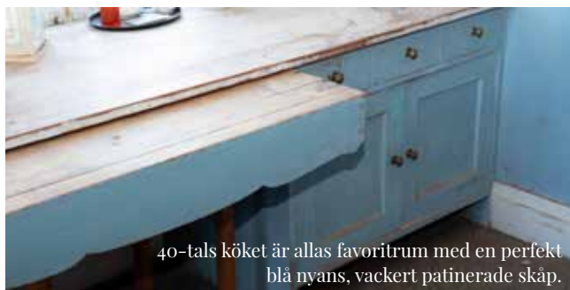
40-tals köket är allas favoritrum med en perfekt blå nyans, vackert patinerade skåp.