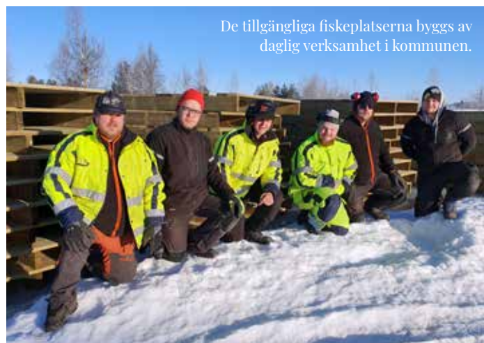
De tillgängliga fiskeplatserna byggs av daglig verksamhet i kommunen.

SYFTE: Att öka antal besökare och reseanledningar i en tillgänglig och hållbar fiskedestination.